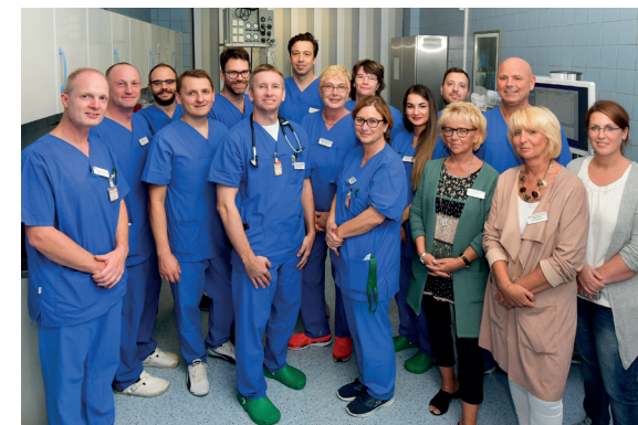
Das Team der Gastroenterologie am Helios Klinikum Niederberg.

TIPS ist die Abkürzung für einen Transjugulären Intrahepatischen Portosystemischen Shunt und bezeichnet eine minimal-invasiv geschaffene Verbindung zwischen der Pfortader und der Lebervene durch die Leber hindurch (Portosystemischer Shunt). Mit dem TIPS soll erreicht werden, dass ein gewisser Teil des Blutflusses von der Pfortader nicht in die Leber, sondern direkt in den großen Blutkreislauf fließt. Dieses Verfahren wird verwendet bei chronischen Lebererkrankungen (Leberzirrhose), bei denen es zur Bildung von großen Mengen Bauchwasser (Aszites) gekommen ist, stattgehabter oder drohender Blutung aus großen Blutgefäßen in Speiseröhre oder Magen (sogenannten Varizen) oder Beeinträchtigung der Nierenfunktion (hepatorenales Syndrom).